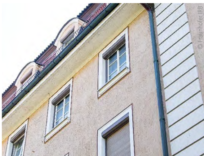
Abb. 1: Außenfassade Gebäudekomplex